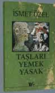
YENİ EDİSYON YENİ ÖNSÖZ ve ÜÇ KİTAP BİR ARADA