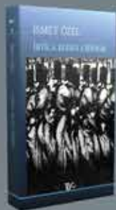
ON ÜÇ YILDIZ SONRA YENİ BASKI