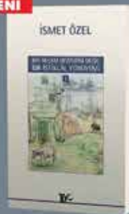
İSMET ÖZEL'İN SON KİTABI