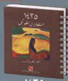
1430 İSTİKLAL TAKVİMİ Kasım-Eylül Her Takvim