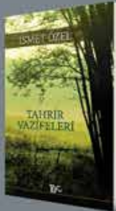
GÖZDEN GEÇİRİLMİŞ 5. BASKI