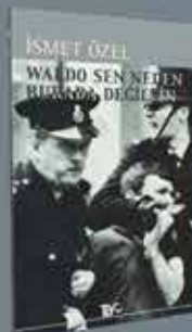
GÖZDEN GEÇİRİLMİŞ 15. BASKI