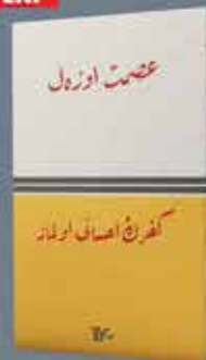
KÜFRÜN İHSANI OLMAZ