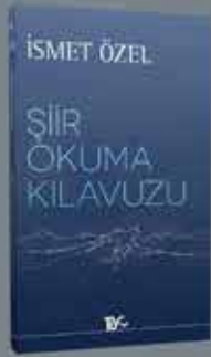
YENİ EDİSYON YENİ ÖNSÖZ