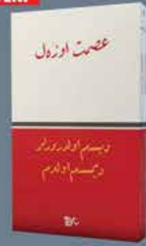
DEŞEM ÖLDÜRÜLER DEŞEM ÖLDÜM