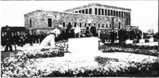
27 Mayıs Anayasa ve Hürriyet Bayramı törenlerle kutlandı