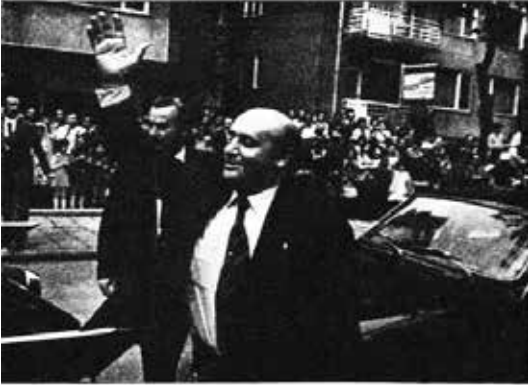
Başbakan Demirel boyun eğilmek için Anayasa Mahkemesine gelirken sevgi gösterisinde bulunan halka karşılık veriyor.