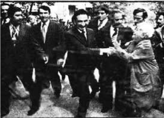
Ecevit'e Anayasa Mahkemesi önünde sevgi gösterisinde bulunuldu. Fotoğrafta kalabalık ortamdan yaşlı bir kadın Ecevit'i kutlamakta görülmüyor.